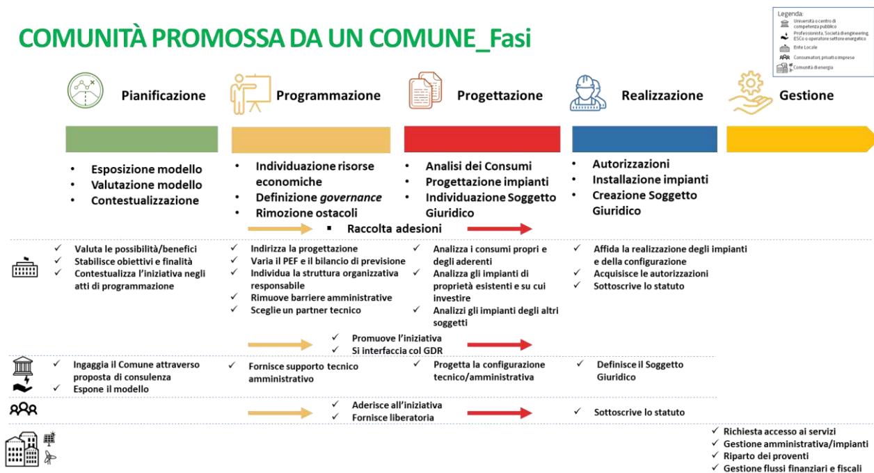
Figura 6 - Fasi per la costituzione di una CER promossa da un Comune